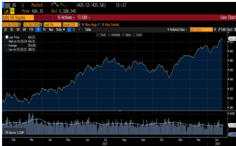
ETF Invesco QQQ (Nasdaq 100 Index)