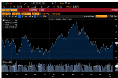
Petróleo WTI (US$/barril)